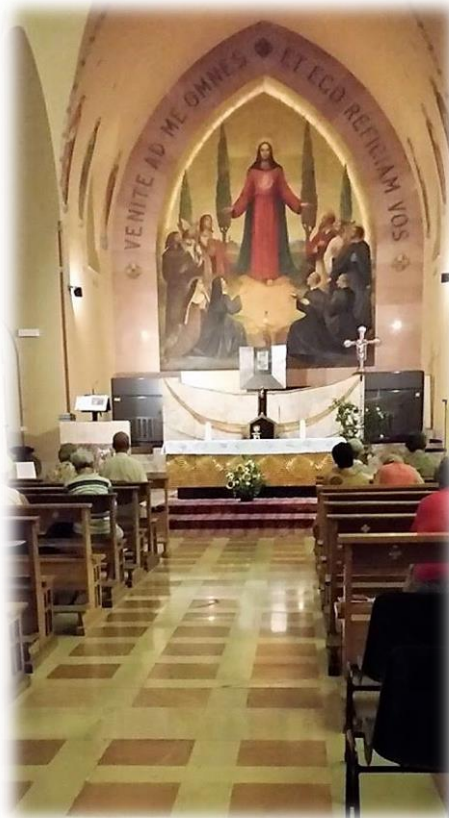
LA CHIESA SACRO CUORE – VILLA LA QUIETE, UPPELLO DI FOLIGNO, ITALY. This is the Church in which our retreat took place in July 2017.